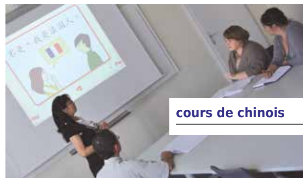
cours de chinois

|| Nos formateurs sont des intervenants expérimentés, de langue maternelle, sélectionnés pour leurs compétences professionnelles. ||